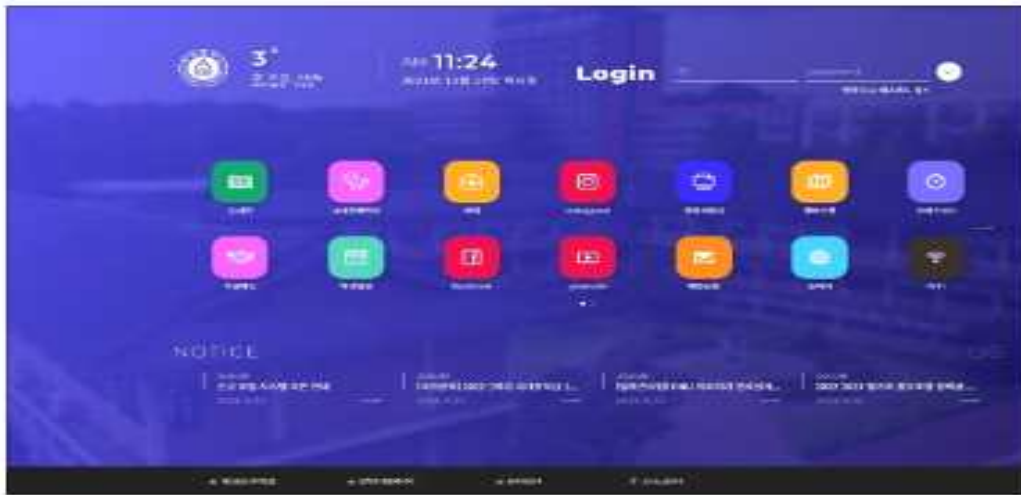
1. 마이포탈 로그인