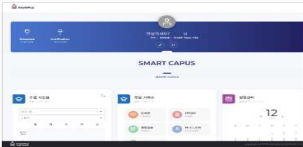
2. 메뉴 클릭