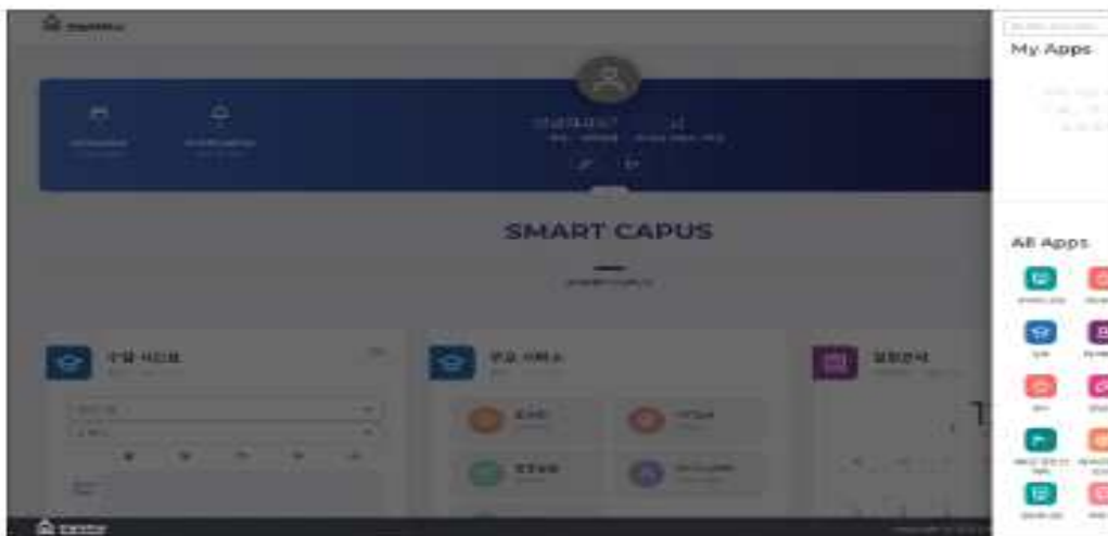
3. 논문 클릭